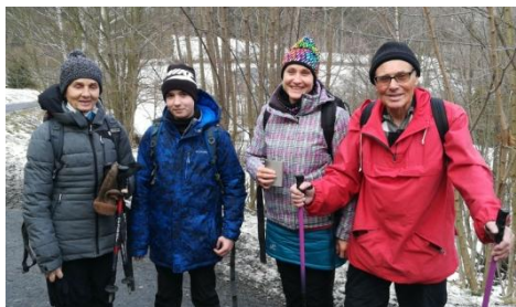
"Kolečko" v Horní Lipové

V Ramzové jsme z okna vlaku marně vyhlíželi naše kamarády, ti ten náš vlak nestihli.