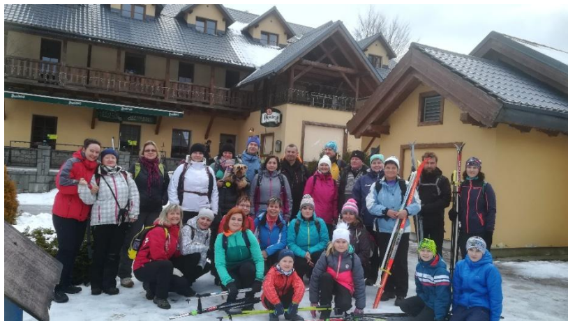
"Kolečko" v Ramzové