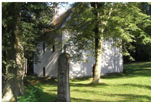
kostelíček Božího těla v Bludově

Obě skupiny si výlet užily, bylo opravdu krásně, sluníčko, rozhledy a nakonec ani ta výluka nebyla tak přeplněná, jak jsme se obávali. I pár hub jsme po cestě našli.