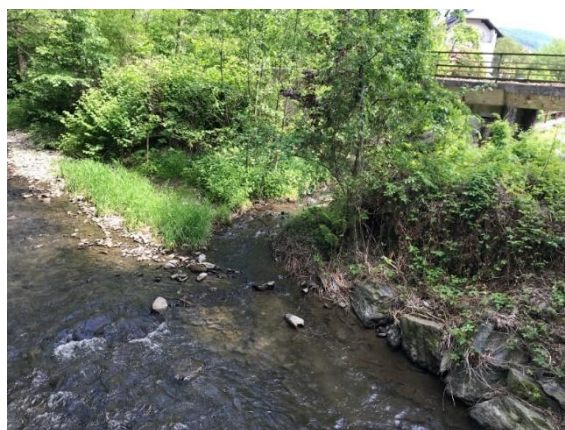
soutok Bystřice a potoka Hluboček